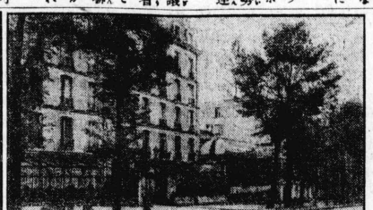
此日の講和 準備會議

日本提案の人類案と其敗北 英米兩國の反對理由と魂膽 我が特使の聲明 五月一日に於いて、本報特派員 山中 伸二 記者の報告に、本報特派員 山中 伸二 記者の報告に、本報特派員 山中 伸二 記者の報告に、本報特派員 山中 伸二