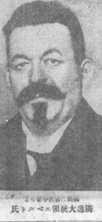
氏トルベニ傾統大逸獨