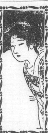
間の山 (後編) 三三 中里生

米國主義の精神を以て、米化運動の第一歩を踏み出す。米國主義の精神を以て、米化運動の第一歩を踏み出す。米國主義の精神を以て、米化運動の第一歩を踏み出す。