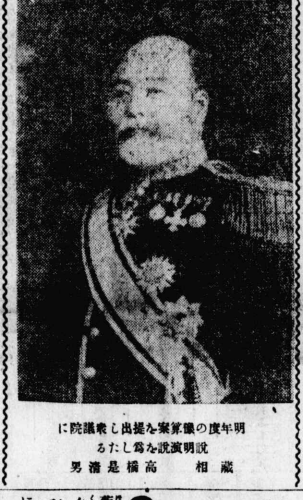
此は高橋蔵相の肖像也。...