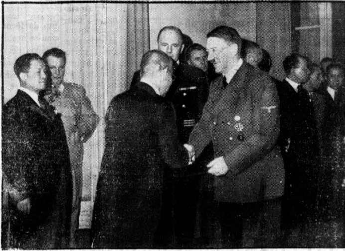
【写真説明】松岡外務大臣が初めてヒトラー総統と會見せる際の記念撮影...