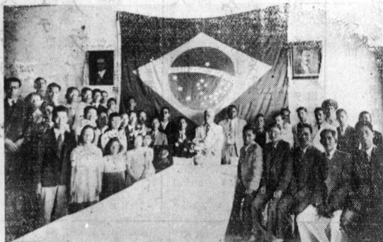
O pavilhão nacional oferecido ao presidente Vargas

cias artificiais. Com o controle definitivo da epifítia poderá ser ligado ao aumento da resistência da planta; decrescimento da quantidade ou diminuição do patógeno foram adotadas as providências adotivas ao estudo da natureza física, química e mecânica do solo e das variações dos fenômenos atmosféricos com relação à intensidade da fuzaríose foram tomadas outras medidas que visam o estabelecimento de ensaios de plantio em diferentes épocas; a relação argila, areia, humus e a adubação com elementos menores. Ataca assim o Ministério da Agricultura por intermédio do Instituto de Experimentação um dos problemas mais graves para a cultura do algodoeiro.