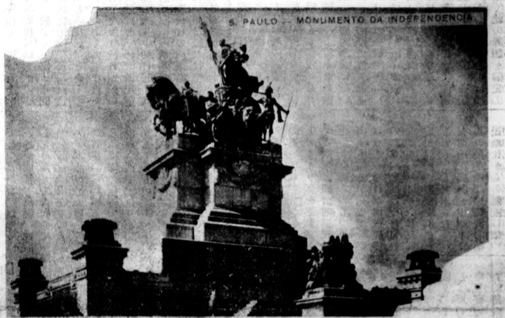
(碑念記立獨ルジラフのゆ盤に上丘のガンラビイ市聖)