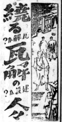
続る瓦解の謎 九尾至 國玉(作)