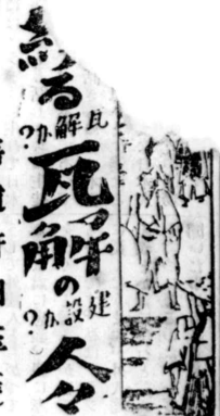
三九日祝の登城 細谷忠興、相馬千之助、 三島三郎、淺田博樹、吉野 政助、豊島邦之助、高畑萬 蔵、内田萬之助等の浪士は 國家のためには藩府のた めに老中安藤守忠を討 たんと決心して、その時 は正月の十五日、場所は坂 下門と決意した。この 時、西下下官邸には居ら ず、濱町川岸の屋敷に居 幸ひに病におこたうし故 今日は登城したる支度 は混雑してゐる。それは大 名の登城を見物する者が多 いため、また下座見とい つて見付、これは大名の伊 達達、これは増田の伊達 のことを申すが、その伊達