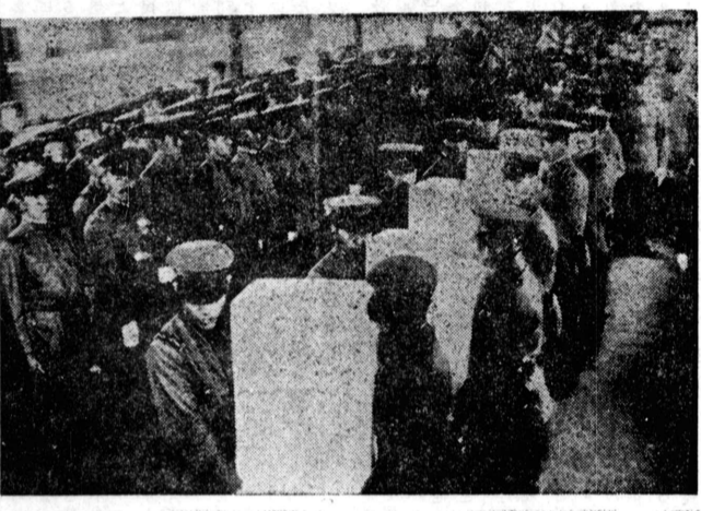
上 吉市街占領直後の姿 下 遺骨を京東に迎ふ

【観戦後記】 フランの観戦より 前夜の雨のためグラウンドの 水溜りがあるその上 思ひ出した様に小雨がし ぽつぽつと降り出し、山 本は熱心にゲームに見 られるのだ ▲青年軍老年軍の一戦は内 山嶺嶺の始式で始まる 早くも四点を先取した老年軍 意気軒高 さなきだに口八 丁 藤澤四球 谷投術に長澤 遠せし藤澤は二進に到殺せ られ太田二進 ▲アアヒ マルチネリ遊撃安 打江澤遊撃はマルチネリ二 進せし藤澤投術に重殺さ ▲アア江澤投術 アマデウ