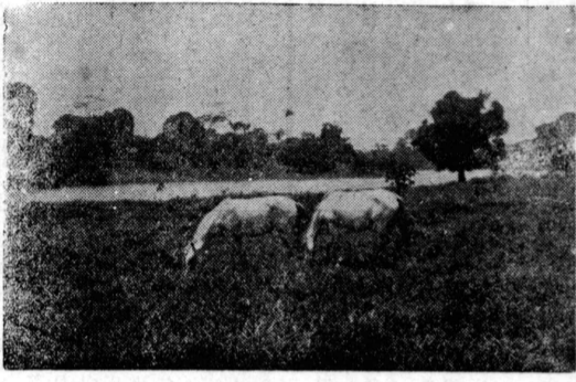
アマ産業研究所内牧場