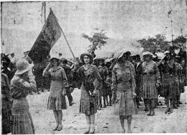
香園粉陣 五十日五のオリ大兵式列今に世の珍しき

経済界の不況に際して、失業の苦境に陥つて居る者、誠に多し。赤十字の救護班も間に合はず、途方に暮れる失業群。市内の失業者は、益々増え、一方の無給供給、就職の世話など、この人達の生活難は、いよいよ深刻となり、明日はさきより、更に四萬一千四百九十九名が、食料を配給し、一日の生活を維持するに苦しむと云はる。