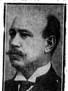
隠れたる親日教授