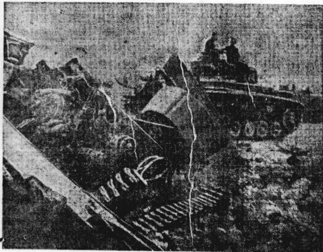
"Tanks" russos destruídos pelos alemães

Seus maquinismos locomóveis de guerra tem demonstrado alta eficiência em todas as batalhas. Os tipos fabricados no início eram de pequeno porte, 5 toneladas, dotados de velocidade de 45 kms. por hora. Os alemães passaram a construir em seguida "tanks" de 8 e 18 toneladas. Esses carros são mais rápidos que os do exército russo e são blindados com chapas de aço mais grosso e de maior resistência. Os maquinismos tuteônicos são mais grotescos que os russos, dotados de linhas mais suaves e delicadas, porém, menos eficientes quanto à ação bélica.