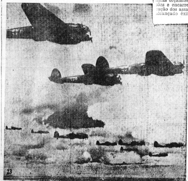
Aviões de caça alemães numa formação de combate

As forças motorizadas teuto-nicas orçam-se em 20 a 30 divisões e encarregando-se da execução dos assaltos rápidos, tem alcançado êxitos brilhantes.