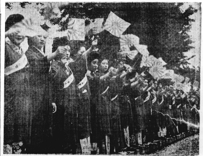
Com o Dia da Marinha, no Japão, foi comemorado o 36.º aniversário da base do Mar do Japão; nesse dia, 27 de Maio, membros de várias associações femininas de Tokyo compareceram à Base Naval de Yokosuka, levando a Bandeira naval para saudação dos marinheiros