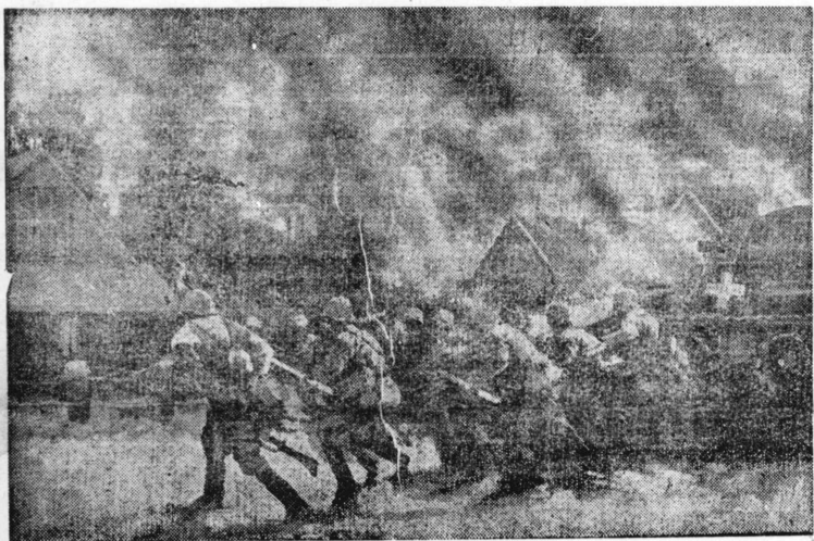
Avanço das forças germanicas

Além disso, acredita-se que dentro em breve serão lançados à luta outros quatro ou cinco milhões de homens.