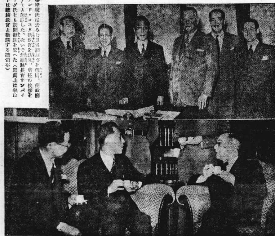
新任領事官が来る七日、領事館に...