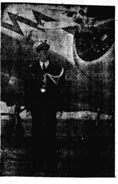
ブラジルの教育界... (Caption for the photograph above)