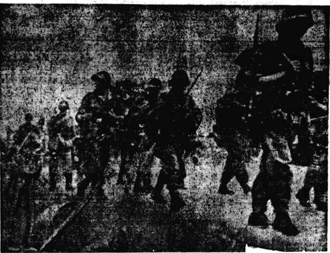
Avanço de Forças Alemãs 擊進猛の軍獨・里千脚鐵

〔東京廿八日UP〕本日、天照天皇陛下御親臨の下の下野閣議本會議開せられ、日・佛印協定に關する議事が進められた 〔東京廿八日UP〕一審特別會議は本日午前一時官中において開議され、日佛印共同防衛協定批准の御裁可を請願したものである