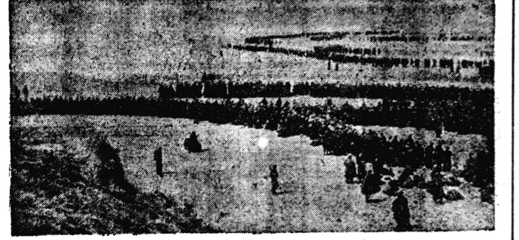
軍赤たつたと虜捕の軍獨

【東京廿七日電】日本軍は佛印進駐を開始し、土着軍の協力下、皇軍無血進駐成る。日本軍は佛印進駐を開始し、土着軍の協力下、皇軍無血進駐成る。