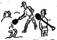
中原會戰の謎、シヤベル兵