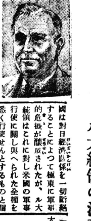
ル大統領の決意益々強固

【ワシントン廿七日電】ル大統領は對日宥和政策を放棄し、武力行使も辭せず、ル大統領の決意益々強固。