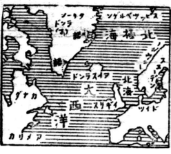
東洋の地勢は恰もこの三國同盟の要衝を占めて居る...