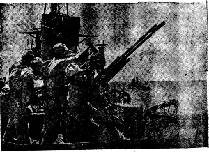
隊部上江るす躍活に蕩掃敵殘 艦隊日本海軍の行動