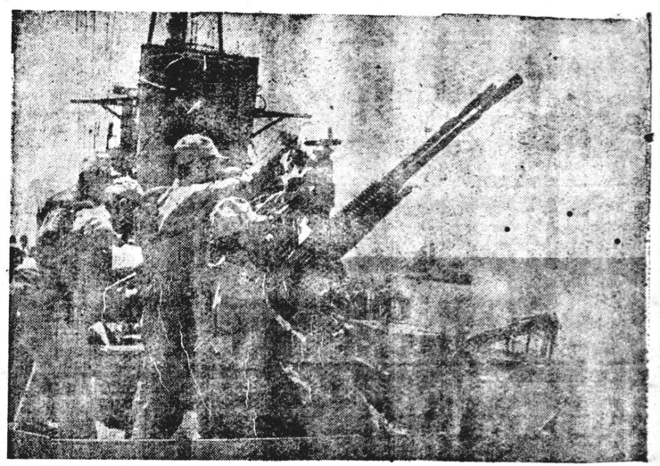
絶根子分日抗 A esquadra japonesa