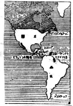
汎米道路の完成は、北米から南米まで、全米を貫く。この道路は、交通の便を大いに増進し、経済の発展に大いに寄与する。現在、この道路の大部分は完成しており、残りの部分も近い将来に完成する見込みである。