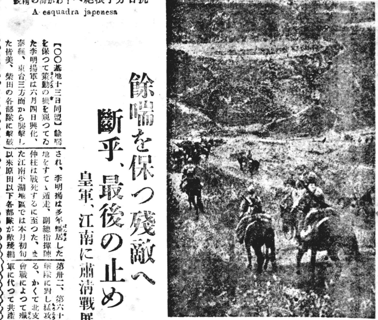
火戦は續く大陸江方面 For as japonesas na regio de Kiang-Nan

日ソ通商交渉 三年越しに妥結 兩國經濟關係愈々緊密 【東京十三日UP】日ソ通商交渉は、三年越しに遂に妥結した。これは、日ソ兩國の經濟關係を更に緊密にするものとして歓迎される。交渉は、一九三四年から開始され、一九三七年に完了した。この交渉の結果、日ソ通商手続が簡便化され、兩國間の貿易が促進されることになった。