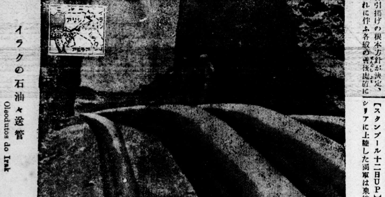
イラクの石油管 Oleoductos de Irak

（ロンドン十二日U.P.）ドイツの訪問が予定されている。ドイツの訪問が予定されている。