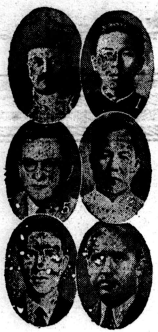
リンス(1)サルデフ、(2)サルデフ、(3)サルデフ、(4)サルデフ、(5)サルデフ、(6)サルデフ

既報、國際の三編目で國際振興會が行はれた、中南米の應募九六の中、入選者数は一番！