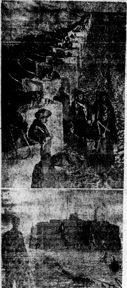
獨逸の攻撃に備へ英本土の警戒ぶり A vigilância inglesa contra o ataque alemão