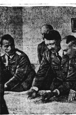
作戦を練る獨軍首領