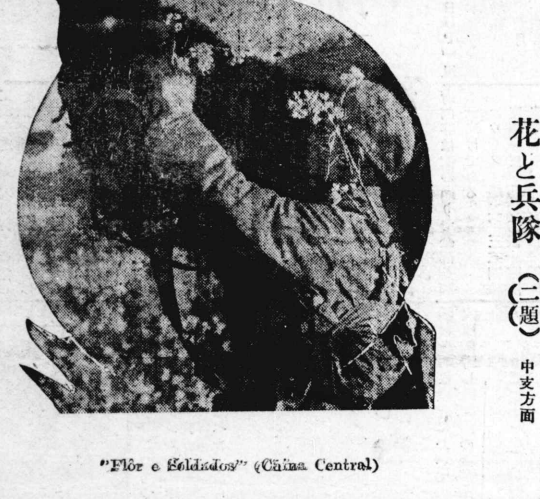
花と兵隊 (三題) 中支方面