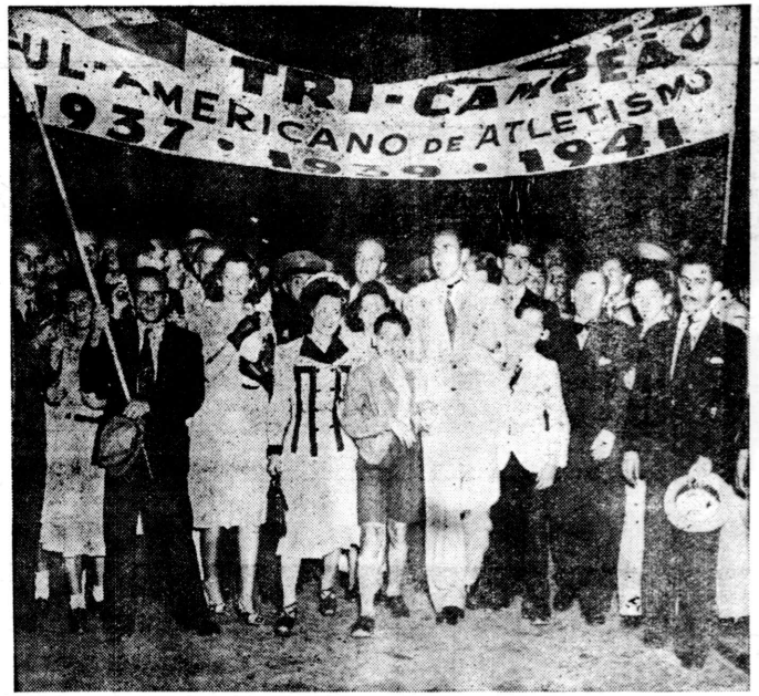
凱歌高し 伯國陸軍上陸 連土三 伯國陸軍上陸の凱歌高し。連土三、伯國陸軍上陸の凱歌高し。伯國陸軍上陸の凱歌高し。

五月五日の凱歌高し。伯國陸軍上陸の凱歌高し。連土三、伯國陸軍上陸の凱歌高し。伯國陸軍上陸の凱歌高し。