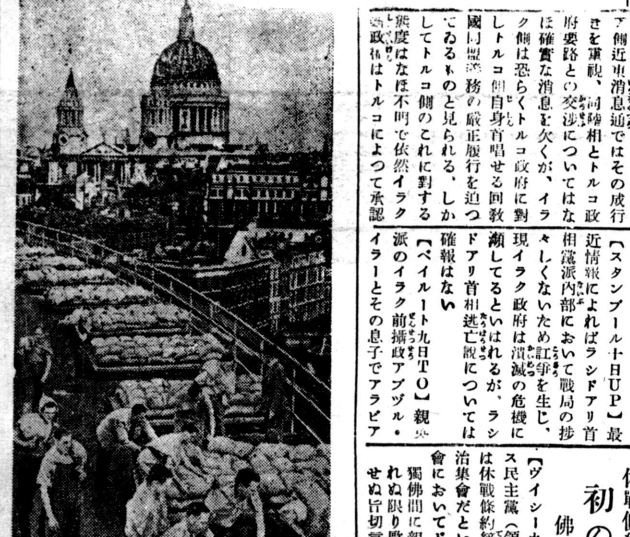
上空爆下の英京 下防空に必死