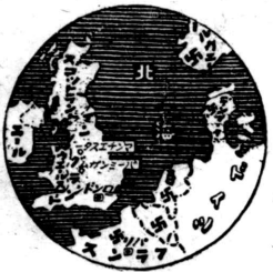
地中海の戦ひは大西洋の戦ひといへよう...