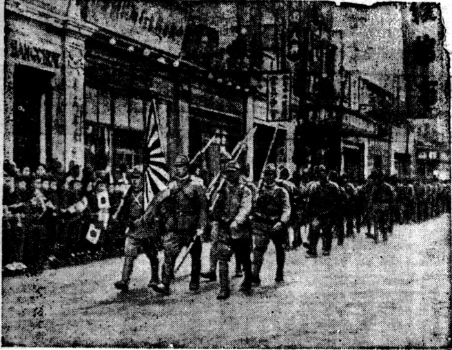
一城入と々堂軍皇— Entrada de forças imperiais numa cidade chinesa

【ローマ廿二日ロ】至急報「アチネ廿二日ロ」外國人防禦第二線を突破すれば、ギリシヤは現下の危局に對し、非常ソス半島に逃げ込んで抗戦を推し進めようとするが、これを阻止するがため、ギリシヤは早くも號外發行した