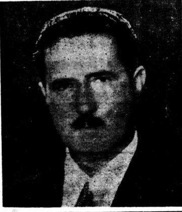
これは氣短かな！ ちよいと癪に障っただけで 電車目掛けて拳銃亂射