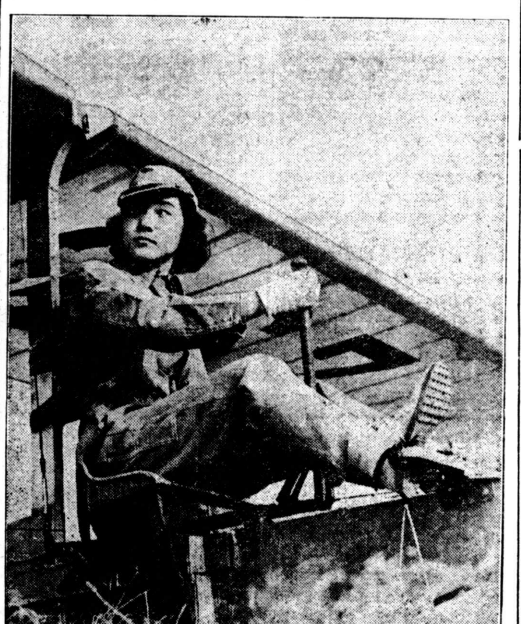
As moças do Japão, de ha muito deixaram de ser o que eram. Destemidas e entusiasmadas as aviadoras estão preparando o terreno para a vinda dum a mulher japonesa. As progressistas jovens do Japão estão mostrando aos moços modernos que elas, também, podem cortar os céus até mesmo como pilotos de planadores.