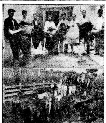
Em cima, os ladros detidos pela policia de Marilia, em baixo, parte dos animais roubados.