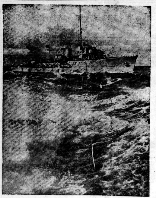
獨哨戒艇隊の活躍 - 北海方面