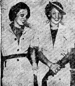
Carmen e Aurora Miranda へ幕銀てつ揃

三月三十一日開校式舉行 輝やく門出 ボンベイ商業學校 三月一日開校式舉行 輝やく門出 ボンベイ商業學校