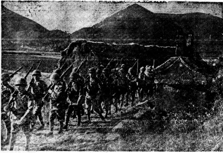
Oensiva japonesa no sul de China

【ブダペスト七日UP】外交界筋の情報を綜合するにヒトラー總統はユーゴ國バウロ攝政に對し、獨逸軍のユーゴ領内通過を要請するだらうとし、一般にユーゴは既に樞軸側の衛星と化したとみられ、今や英國は到底ユーゴの中立を保持せしめる望みは絶え兩國の友好關係は日増しに冷却しつゝあるとしてゐる。