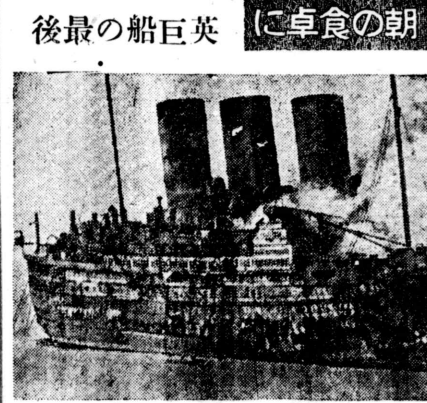
朝の卓に 英巨船の最後 この巨船は、英巨船の最後。...