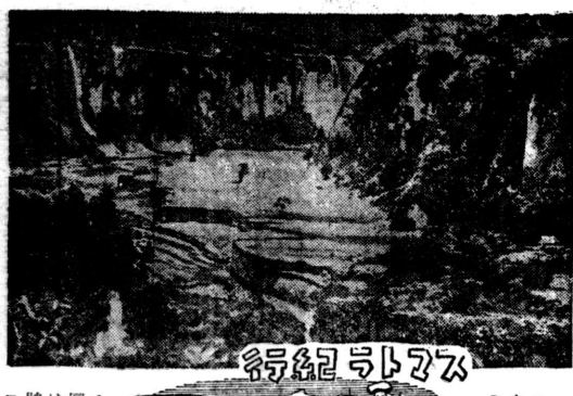
パダン高原の花咲く

パダン高原の花咲く。この高原は、雄大な自然美を誇る。春になると、高原に咲く花々が、訪れる人々を魅了する。この高原は、伯國の重要な観光地であり、多くの観光客が訪れる。高原の風景は、雄大な自然の雄姿を表現しており、訪れる人々の心を癒やす。