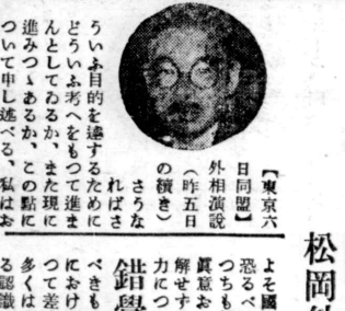
錯覚を抱くことが日米間悪化の原因

【東京五日路透電】日米間の悪化は、互いの錯覚によるものである。日米間の悪化は、互いの錯覚によるものである。