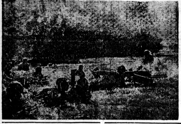
逃げ惑ふ敵に猛射—南支方面

【ワシントン五日路透電】米大統領の統帥権に関する論争は、政界で白熱的論争を起している。米大統領の統帥権に関する論争は、政界で白熱的論争を起している。