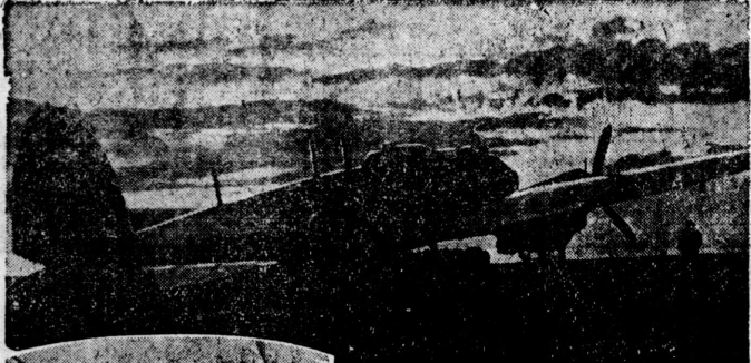
機撃爆轟す出飛に襲夜土本英