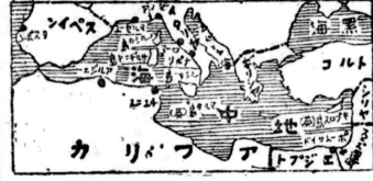
地中海攻撃の前奏か

獨伊兩巨頭會談内容を探る (ベルリン 瑞西廿日米UP) イタリヤ首府ローマとの通信は一切断絶したまゝあり、ヒ總統とム首相の會談は極秘に付されてあるが、兩巨頭の會見は確かに行はれ場所も勿論不明だが多分ドイツ領内で行はれたものと推定されてある。従つて會談内容の如きも獨伊極端側からのものは皆目不明だが、當地に達した情報を経合すれば兩巨頭會談をめぐつて傳へられる極端側今後の作戦は大要次の如くではないかと想像されてある。 一、フランスに對する攻撃は行はれてゐるが、この攻撃の遂行に和條件が論ぜられたものと見、前首相會見もこれに關係あり。フランスに對する攻撃は行はれてゐるが、この攻撃の遂行に和條件が論ぜられたものと見、前首相會見もこれに關係あり。