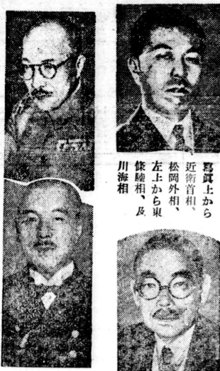
眞上から 近衛首相 松岡外相 左上から 齋藤首相 川海相

東京十八日同盟)政府と各界代表との懇談會は政界を中心に十八日或いは十九日に懇談會を開く予定であつたが、