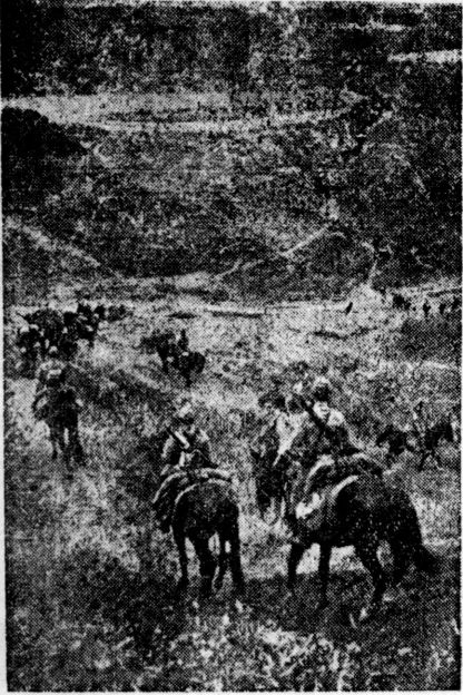
征馬は進む 中支方面