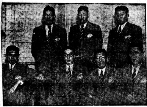
訪日選手團のメンバーたち。前列は選手、後列は随員や関係者。

名古屋の交驪陸上競技會 訪日選手團は、名古屋の交驪陸上競技會で優勝した。これは、訪日選手團にとって初めての優勝であり、大きな励みとなった。選手たちは、大会を通じて日本の陸上競技の発展に貢献し、日本のスポーツ界に大きな貢献をした。優勝を機に、訪日選手團は、今後も日本の陸上競技の発展に力を入れていく方針である。