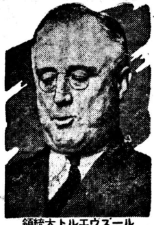
大統領トルエウズール

その基調は大體舊態の如く... 米は民主主義の兵器廠... 新年初議會に教書を朗讀