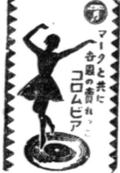
コムニ コムニ コムニ