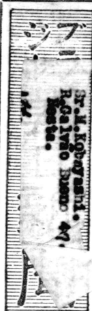
伯國市街市マスコット カマン街一〇九 外館電話共百廿二