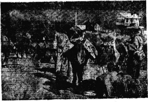
明説眞寫 (實物に等するものを輸出して運送) 人郭支民出に送輸