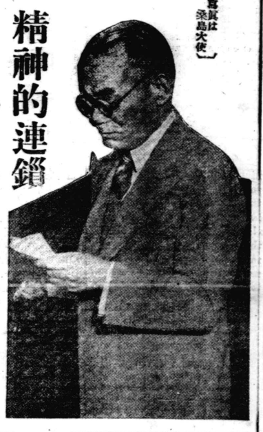
精神的連鎖 いよく強化へ!

日伯文化協定の締結については、二面から見てみるが、明治廿八年十一月フランス駐在日伯公使館において調印された日伯通商航海協定以来、はじめて兩國間に締結された文化的協定であるが、本協定の締結は桑島大使の努力によるものである。