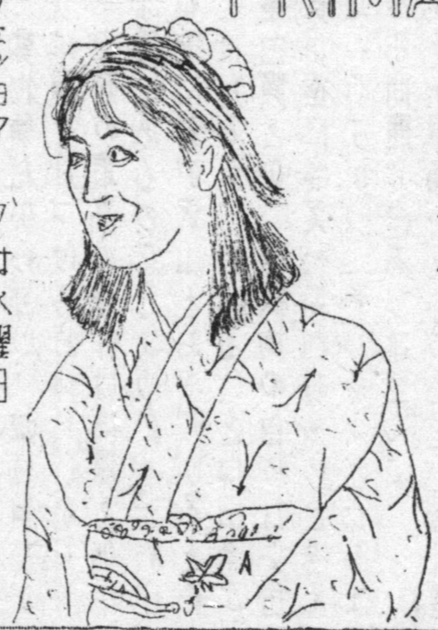
フェジョアーダは水曜日

御宿泊と御食事に 御会食と御宴会に 御家族伴の御食幸 日本料理とフランス料理 バストス名産料理 御婚礼の披露宴等の御用命は 当店を御利用下さい