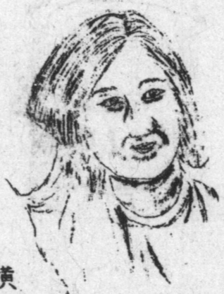
おしらせ ドミンゴ祭日 でおもてのポルタ がフェシマの時でも 横のポルトンより