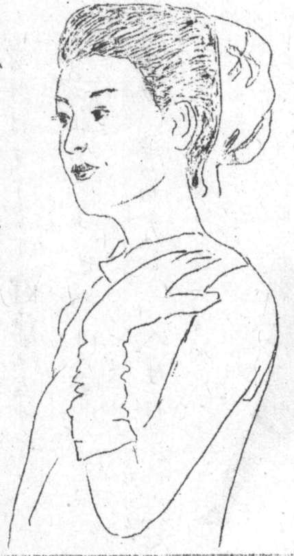
エレガントな髪型

去る十一月十四、十五の連休を利用して、ブラ製糸では従業員をオニバスに分乗、カンピナス市で開催中の養蚕祭を見学に出かけた。内二三人が車によって同市サンタカカに預けられ、翌日クルマで迎えに行くといつた付録もあつた由。