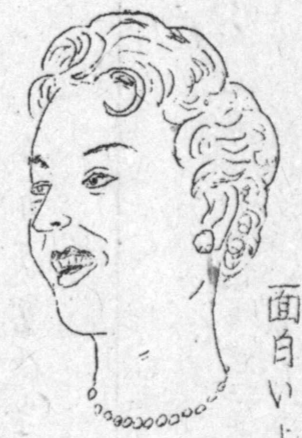
面白いように編め ます