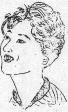
新しいミシンの頂戴いたします