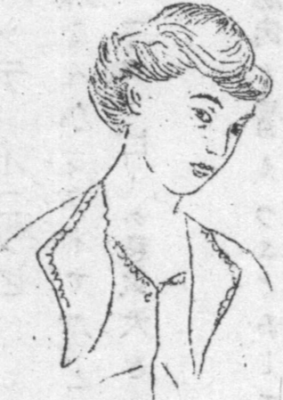
最新 モーダ 美しい